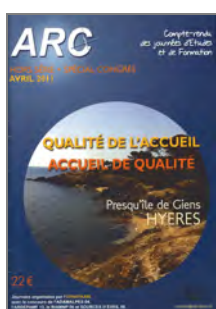
Qualité de l'accueil, accueil de qualité 2011 Presqu'île de Giens (83)