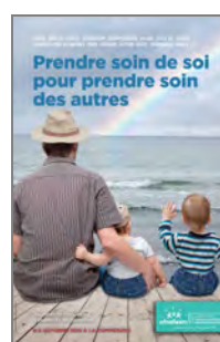
Prendre soin de soi pour prendre soin des autres 2016 Pommeraye (49)