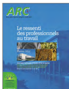
Le ressenti des professionnels au travail 2012 Reims (51)