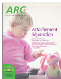
Attachement séparation 2013 Paris (75)