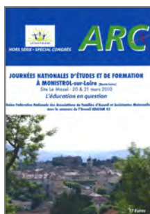
L'éducation en question 2010 Monistrol-sur-Loire (43)