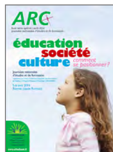
Éducation, société, culture, comment se positionner ? 2014 Rennes (35)