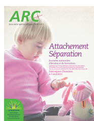
Attachement séparation 2013 Paris (75)