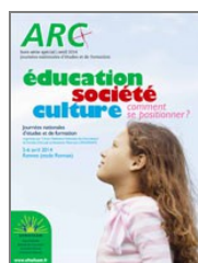
Éducation, société, culture, comment se positionner ? 2014 Rennes (35)