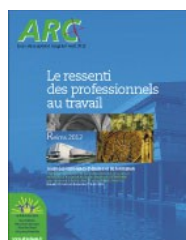
Le ressenti des professionnels au travail 2012 Reims (51)