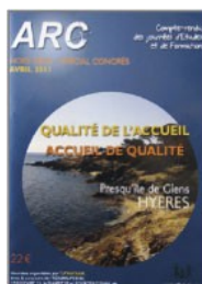
Qualité de l'accueil, accueil de qualité 2011 Presqu'île de Giens (83)